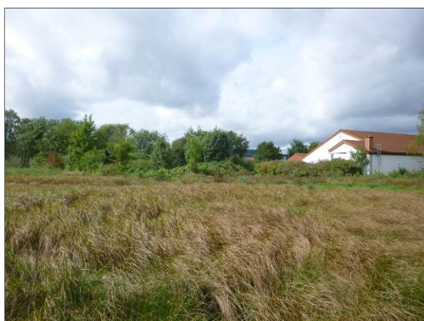
Abb. 4: Feuchtwiese im südlichen Bereich