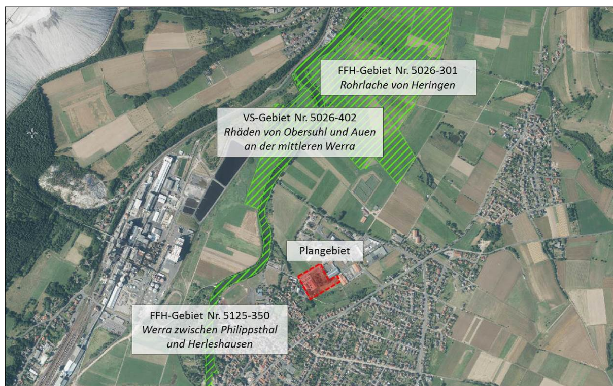
Abb. 17: Lage des Plangebiets zu Gebieten des europäischen Schutzgebietsnetzwerks „Natura 2000“ (Quelle: http://natureg.hessen.de , eigene Bearbeitung, Stand: 23.03.2017)

Während sich die zwei letztgenannten Schutzgebiete aufgrund der Entfernung und in Richtung Plangebiet bereits bestehender baulicher Barrieren außerhalb des Einwirkungsbereichs des Vorhabens befinden, wird zur Überprüfung möglicher Wirkungen auf das FFH-Gebiet Nr. 5125-350 nachfolgend eine Natura-2000-Prognose vorgenommen: