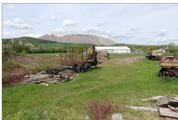
Abb. 14: Lagerplatz