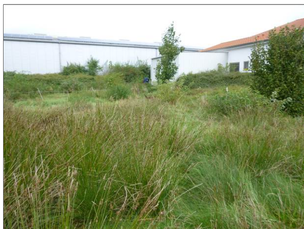
Abb. 2: Feuchtwiese im südöstlichen Bereich