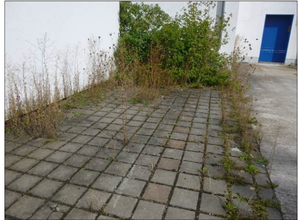
Abb. 7: Fugenvegetation im südlichen Parkplatzbereich