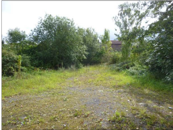
Abb. 6: Schotterfläche mit angrenzenden Ruderalfluren und Laubgehölzen