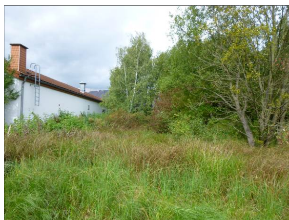
Abb. 5: Feuchtwiese und Gehölze

Die im Bereich einer alten Aufschüttung vorkommende Ruderalflur trockener Standorte setzt sich v.a. aus Beifuß ( Artemisia vulgaris ), Weißem Steinklee ( Melilotus albus ), Brombeeren ( Rubus fruticosus ), Kanadischem Berufkraut ( Erigeron canadensis ), Glatthafer ( Arrhenatherum elatius ) und Raukenblättrigem Greiskraut ( Senecio erucifolius ) zusammen. Weiter östlich finden sich in den Randbereichen zu den Laubgehölzen auch ruderale Säume mit Brennnesseln ( Urtica dioica ), Knäulgras ( Dactylis glomerata ), Acker-Kratzdistel ( Cirsium arvense ), Zaunwinde ( Calystegia sepium ), Brombeeren ( Rubus fruticosus ) und stellenweise Huflattich ( Tussilago farfara ). Im Bereich der Parkplätze finden sich zahlreiche bewachsene Pflasterfugen mit den folgenden Arten: