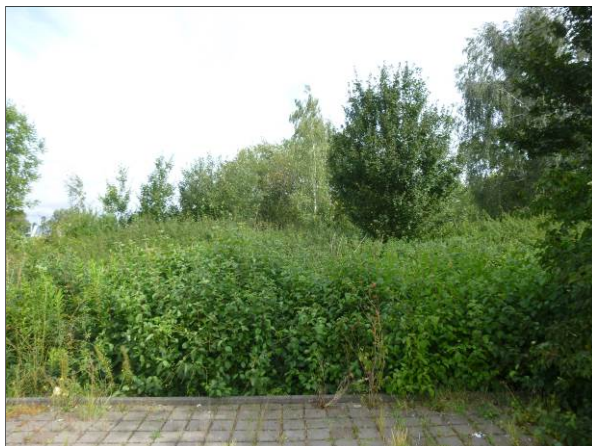
Abb. 10: Ziergehölze und Laubgehölze im nördlichen Plangebiet (Blickrichtung Lagerplatz)