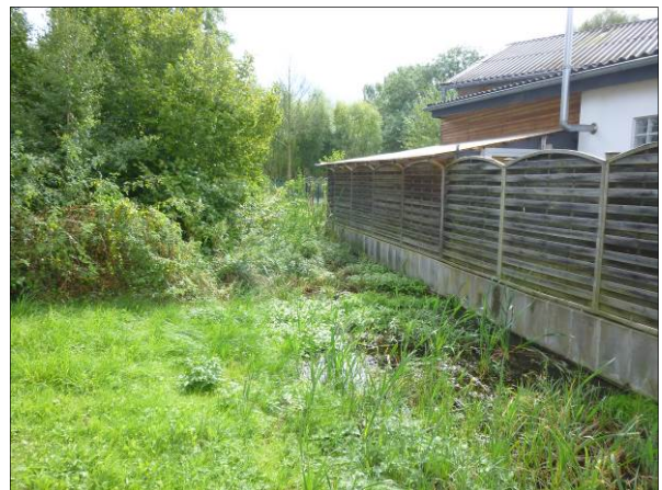
Abb. 9: Rasenfläche und angrenzender Graben im westlichen Plangebiet