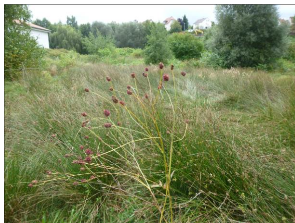
Abb. 3: Großer Wiesenknopf ( Sanguisorba officinalis )