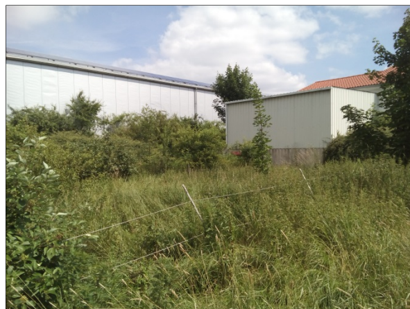
Abb. 13: Ziergehölze im östlichen Plangebiet (geplante Umwandlung in Feuchtwiese)