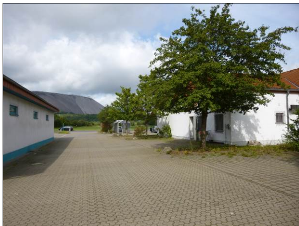
Abb. 8: Stellplatzbereich im Ahornbäumen