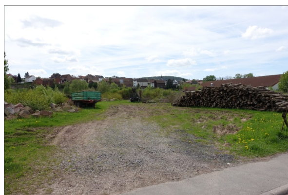
Abb. 15: Einfahrt zum Lagerplatz

Der Bereich des Lagerplatzes wird von Rohbodenflächen, Gebüschsukzession und halbruderalen Wiesensäumen geprägt. Hier wurden im Winterhalbjahr 2017/18 die größeren Gehölzbestände – hier v.a. Sandbirke, Feldhahorn, Hainbuche und Hundsrose – zurückgeschnitten, während die kleinflächigeren Gebüsche mit Blutrottem Hartriegel ( Cornus sanguinea ) noch vorhanden sind.