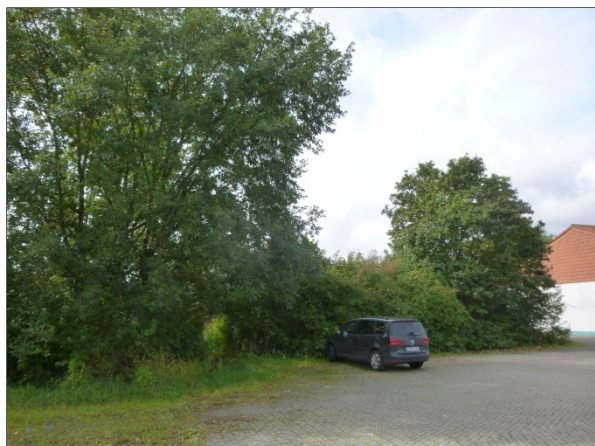
Abb. 12: Großbäume im Westen (Erhalt)