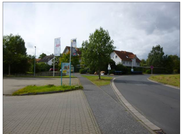
Abb. 11: Riedweg (Blickrichtung Westen)