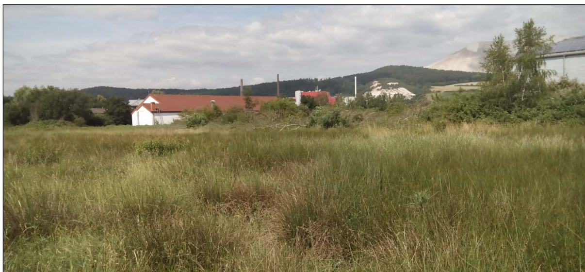
Abb. 18: Maßnahmenflächen zur Entwicklung vorlaufender Ersatzmaßnahmen

Darüber hinaus können durch die vorliegende Planung schützenswerte Gehölze, Feuchtwiesen und Seggenriede in einem Umfang von rd. 0,4 ha gesichert und als kommunales Ökokonto entwickelt werden. Die hier mögliche Aufwertung entsteht insbesondere durch eine an die Bedürfnisse des Wiesenknopf-Ameisenbläulings ( Maculinea nausithous ) angepasste Bewirtschaftung der Wiesenfläche (vgl. Abb. 18) sowie den Rückbau einer Schotterfläche (vgl. Abb. 6) und wird anhand der nachfolgenden Ausgleichsbilanzierung nach der Kompensationsverordnung (KV) des Landes Hessen dokumentiert (vgl. Tab. 2).