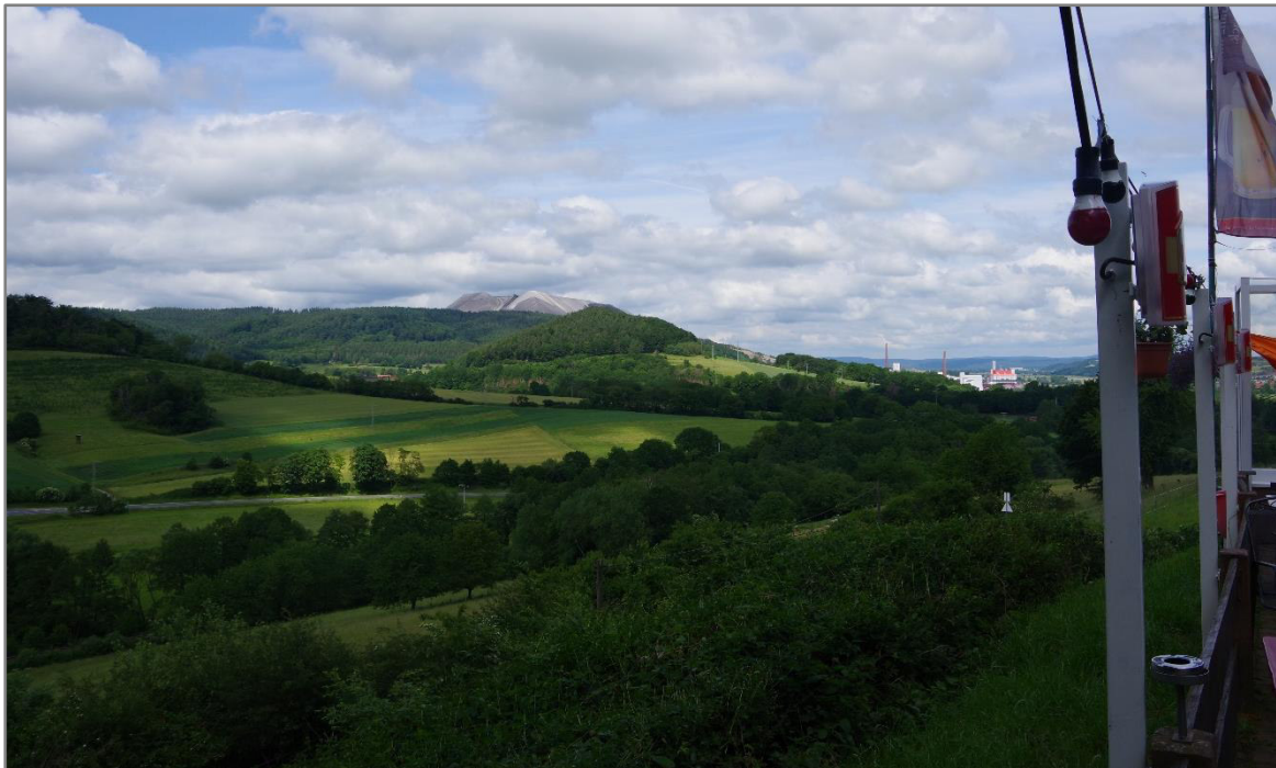
Abb. 2: Blick von der Terrasse nach Norden

Deutlich vorbelastet ist das Plangebiet durch die starken anthropogenen Einflüsse. Vor allem durch die Anlagen des Industriebetrieb K+S Minerals and Agriculture GmbH mit der weithin sichtbaren Abraumhalde und den Industrieanlagen.