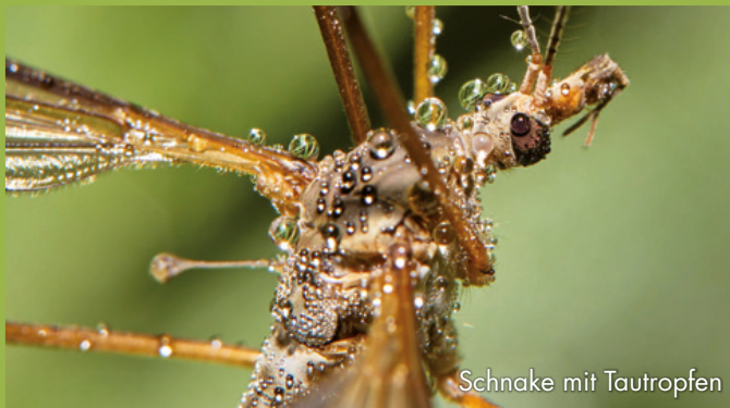
Schnake mit Tautropfen

Rainer Hebler schaut da genau hin, wo andere einfach vorbeigehen und erlaubt mit seinen Fotos Einblicke in eine den meisten Menschen verborgene und mitunter vielleicht fremde Welt. Seine Fotos bilden gestochen scharf die einzigartige Schönheit der Motive ab. Sie zeigen nur durch das Makro-Objektiv erkennbare, manchmal unerwartet