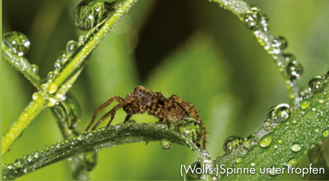
(Wolfs-)Spinne unter Tropfen