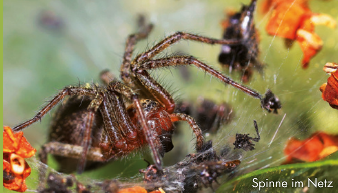
Spinne im Netz